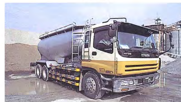
バラセメント運搬車