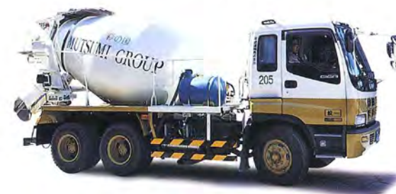
生コンクリート運搬車