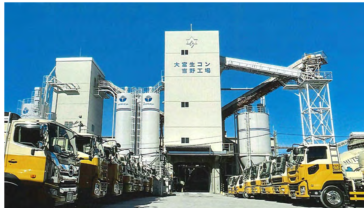
生コンクリート製造プラント

埼玉県知事 許可(般-24)第17089号 とび・土工工事業・内装仕上工事業 タイル・レンガ・ブロック工事業